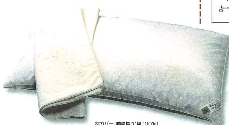
枕カバー: 綿風織り(綿100%) サイズ: 43×63cm 重さ: 2.7kg